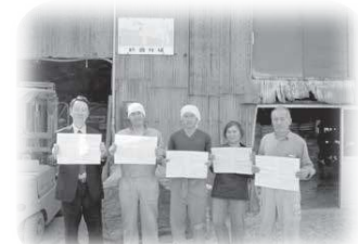
家族全員が意欲とやりがいを持って経営に参画できる魅力的な経営を目指す家族経営協定を締結

牛群検定には6ヶ月間無料で体験できるお試し検定事業があります。 牛群検定を始めてみようかな、と思われた方は下記までご相談下さい。