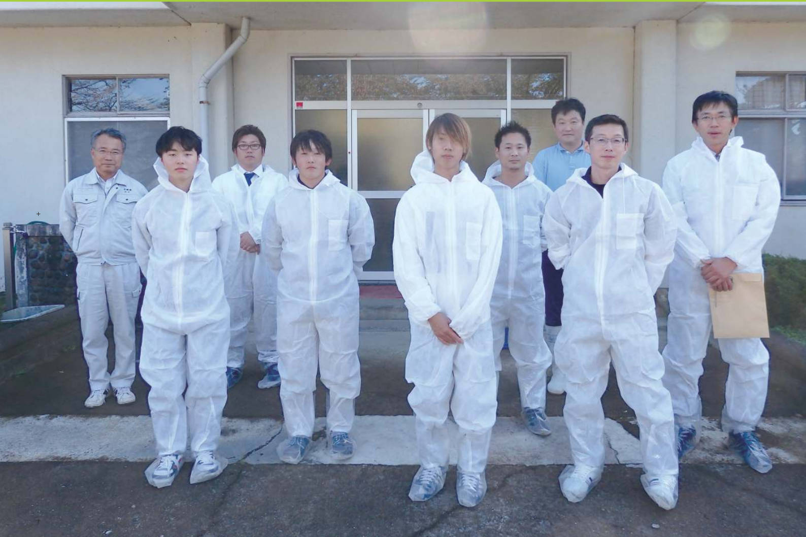
青年部仙南支部視察研修会 ～全酪連若齢預託牧場～