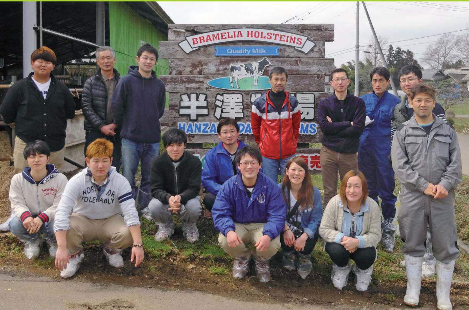
青年部仙南支部視察研修会